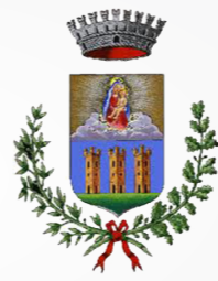
Comune di Maruggio