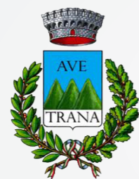
Comune di Avetrana