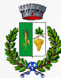
Comune di Fragagnano